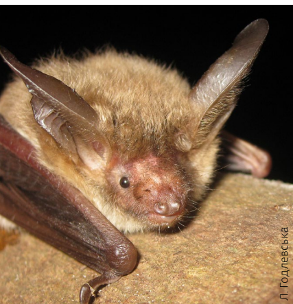
Нічниця довговуха Myotis bechsteinii

Нічниця довговуха є рідкісним видом по всій Європі. Вочевидь, вона значною мірою пов'язана зі стиглими листяними лісами, особливо дубовими та буковими, з добре розвинутим підліском та великою кількістю великих старих дерев. Однак вона може оселятися і в мішаних лісах. Сховищами материнських колоній є, загалом, порожнини у деревах, наприклад дятлові дупла. Зимує ця нічниця у підземеллях. Протягом року колонії нічниць можуть використовувати 30-50 дупел дерев.