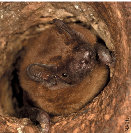
Вечірниця руда Nyctalus noctula

Ця вечірниця є розповсюдженим в Європі видом, хоча на півночі вона відсутня, а в Середземноморському регіоні зустрічається рідше. Вечірниця є переважно лісовим видом з літніми сховищами у деревах, особливо у «дятлових» дуплах. Зимують руді вечірниці, збираючись у великі колонії, в будівлях (особливо у східній та центральній Європі), скельних тріщинах та деревах (в регіонах з порівняно м'якими зимами). Зазвичай вони обирають сховища, які розташовані на висоті понад 3 м над землею. Полюють руді вечірниці над пологом лісу та, загалом, на відкритому просторі.