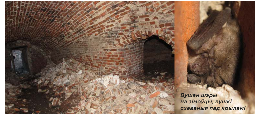
Вушан шэры на зімоўцы, вушкі схаваныя пад крыламі

Выкарыстанне сховішчаў залежыць ад пары года. Улетку жывёлы засяляюць цёплыя месцы, якія добра праграюцца. Зімой, у перыяд спячкі, — прахалодныя, са стабільнай тэмпературай, у сярэднім, ад 0 да +10°C.