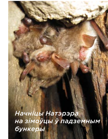
Начніцы Натэрэра на зімоўцы ў падземным бункеры

Кажаны вельмі прывязаныя да сваіх падземных «кватэр». Адно сутарэнне можа быць домам для многіх рукакрылых, якія ляцяць з розных, у тым ліку аддаленых, рэгіёнаў. Таму турбаванне звяркоў у адным сховішчы можа мець цяжкія экалагічныя наступствы нават для тэрыторый, якія знаходзяцца ад яго на вялікай адлегласці.