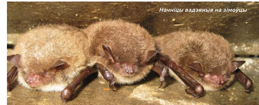
Начніцы вадзяная на зімоўцы

Прынцыпы аховы падземных сховішчаў рукакрылых, а таксама прыклады з розных еўрапейскіх рэгіёнаў — у дапаможніку EUROBATS: bit.ly/39089MK