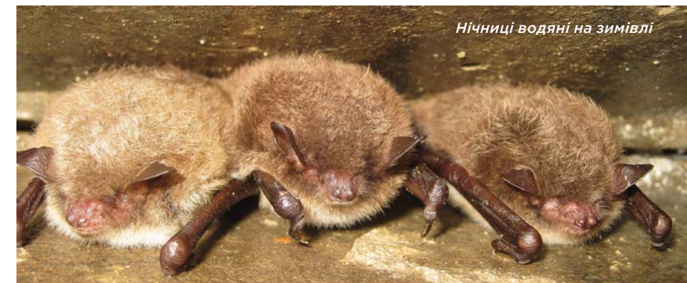
Нічниці водяні на зимівлі

Принципи охорони підземних сховищ рукокрилих, а також приклади з різних європейських регіонів — в керівництві EUROBATS: https://bit.ly/39089MK