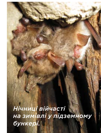
Нічниці війчата на зимівлі у підземному бункері.

Кажани дуже прив'язані до своїх підземних квартир. Одне підземелля може бути домом для великої кількості тварин, які прилітають з різних, в тому числі й віддалених, регіонів. Тому турбування тваринок в одному сховищі може мати значні екологічні наслідки для територій, що знаходяться на великій відстані від нього.