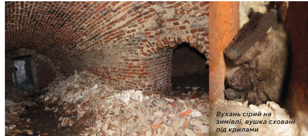
Вухань сірий на зимівлі, вушка сховані під крилами

Використання сховищ залежить від пори року. Влітку тварини, як правило, оселяються в теплих місцях; взимку, в період сплячки, — в прохолодних, зі стабільною температурою від 0 до +10°C.