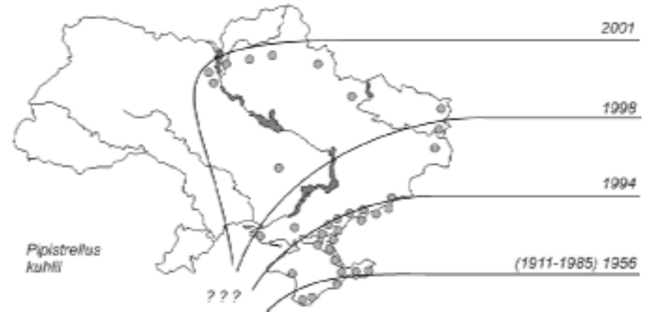
Рис. 1. Розширення ареалу нетопира білосмугого протягом 4-х ключових дат: 1956 — «Фауна України», 1994 — «Червона книга...», 1998 — «Ніч кажанів '98», 2001 — цей огляд. [Extension of range of Pipistrellus kuhlii in Ukraine during 4 key dates].

В Києві вид знайдено 1999 р. [Godlevsky et al. 2000]: 2.11.99 в Центр реабілітації кажанів принесли 4 особин (3♂ та 1♀), знайдених у стані сплячки в одній із шкіл, а 11.12.99 принесли ще 1♀, знайдену в одному з театрів; ще одна особина знайдена у 2001 р., а у вересні 2001 р. один екземпляр цього виду передано з орнітологічного стаціонару «Лебедівка». Протягом 2000 р. цей вид виявлено у Сумах [Мерзлікін & Лебідь 2001], Харкові [Влащенко 2001] і Кривому Розі [Стригунов & Коцюруба 2001].